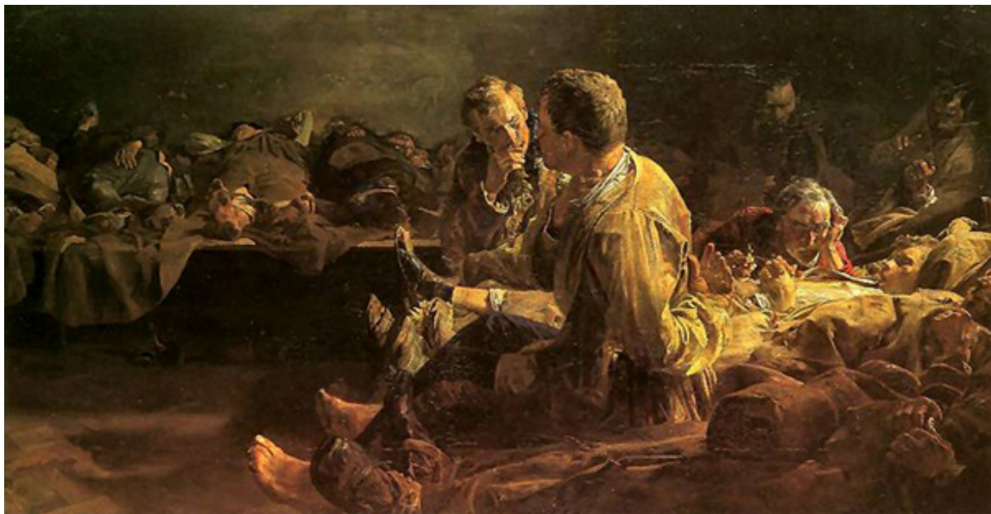
Śmierć na etapie, domena publiczna

Przyjrzyj się obrazowi Jacka Malczewskiego, przedstawiającemu postój zesłańców, a następnie przeczytaj fragment wspomnień Józefa Chołodeckiego. Zdecyduj, które zdania są prawdziwe, a które fałszywe.