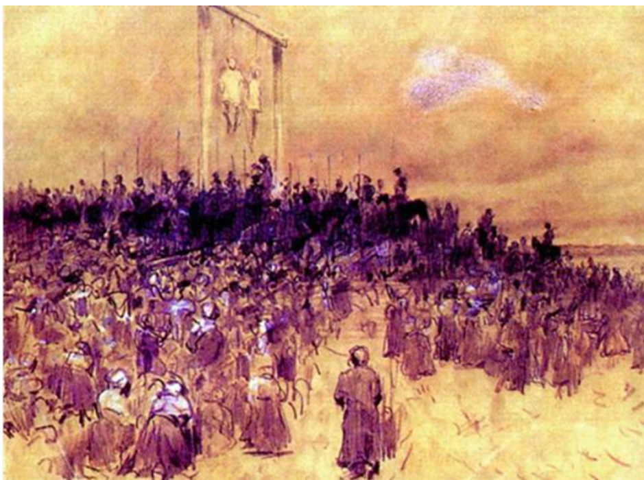
Stanisław Witkiewicz, Wieszanie powstańców w Szawłach , domena publiczna

Przyjrzyj się obrazowi Stanisława Witkiewicza i opisz przedstawioną na nim scenę.