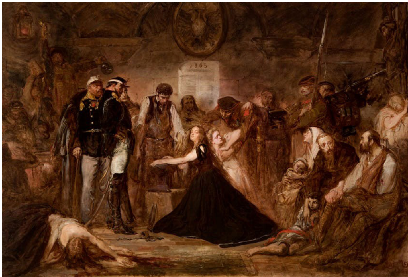
Jan Matejko, Polonia – Rok 1863 (Zakuwana Polska), 1864, Muzeum Książąt Czartoryskich w Krakowie