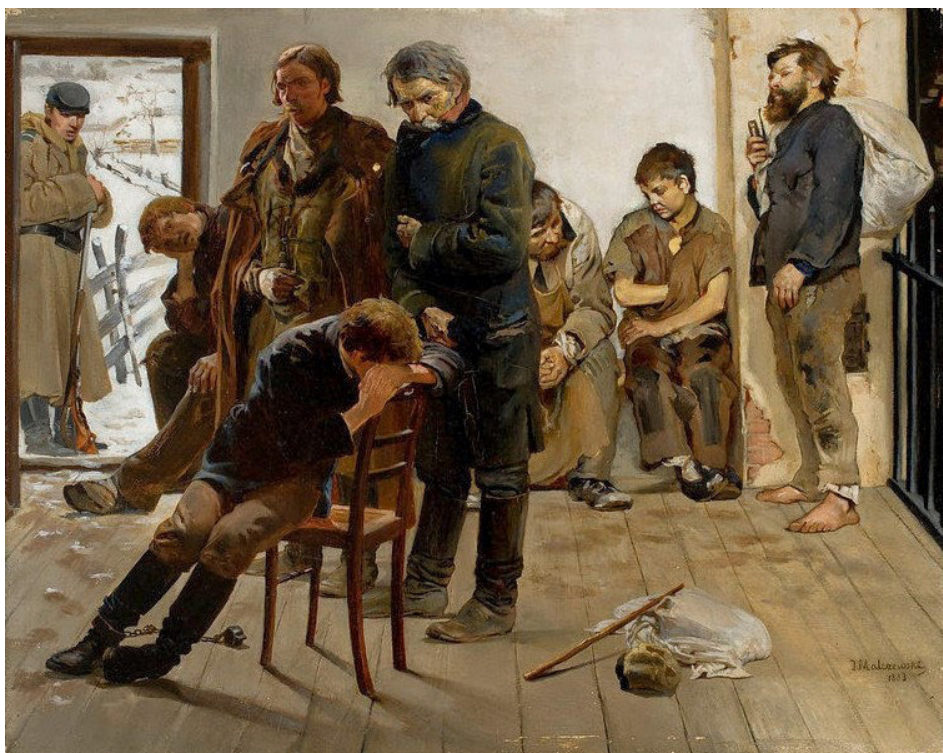
Jacek Malczewski, Na etapie (Aresztanci) , 1883, Muzeum Narodowe w Warszawie, domena publiczna