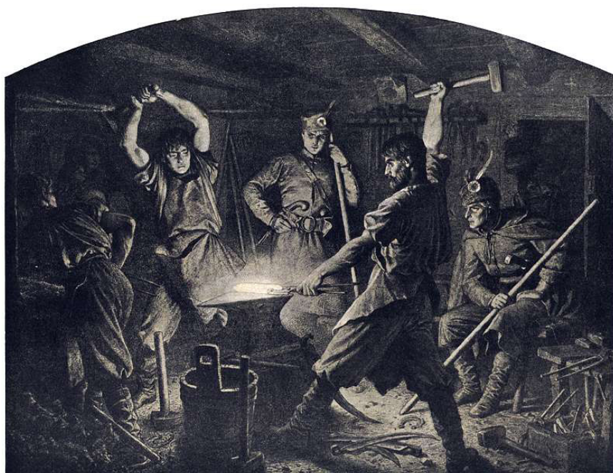
Artur Grottger, cykl „Polonia” III, Kucie kos , Muzeum Sztuk Pięknych w Budapeszcie, domena publiczna