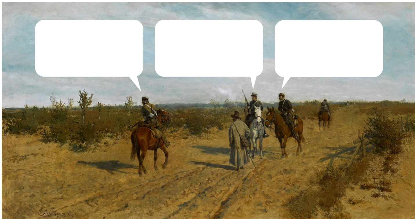
Maksymilian Gierymski, Patrol powstańczy , 1873, Muzeum Narodowe w Warszawie, domena publiczna