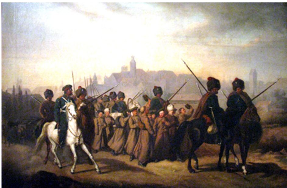
Aleksander Sochaczewski, Branka Polaków do armii rosyjskiej w 1863 roku , domena publiczna

2. ■ Przyjrzyj się obrazowi Aleksandra Sochaczewskiego, a następnie podkreśl prawidłową definicję terminu branka .