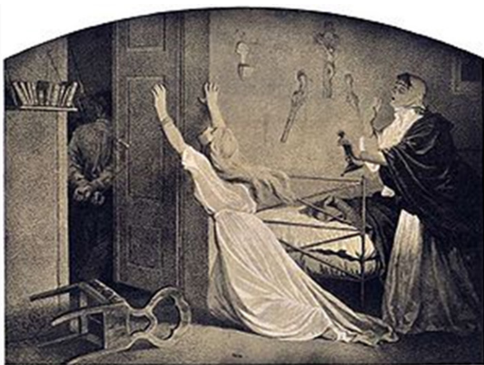
Artur Grottger, Pobór w nocy