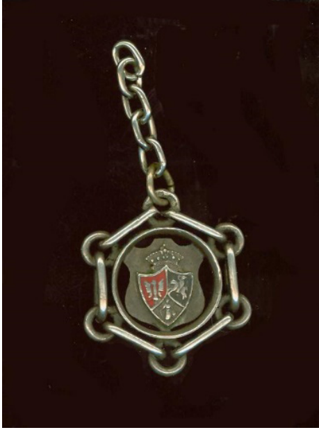
Zawieszka z orłem i trójpolowym herbem Rzeczypospolitej, po 1863, zbiory MHP

5 ■ Przyjrzyj się fotografiom i napisz, jakie akcenty patriotyczne widzisz. Przepisz tekst znajdujący się na broszce. Czy wiesz, skąd pochodzi to wezwanie? Poszukaj informacji na temat śpiewanej podczas Powstania Styczniowego pieśni Boże coś Polskę .