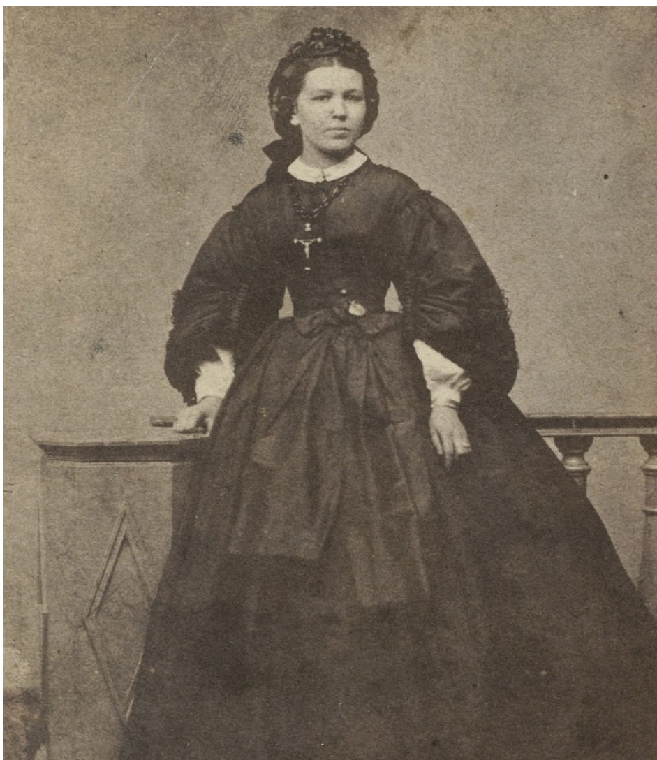
Portret kobiety w stroju z okresu żałoby narodowej