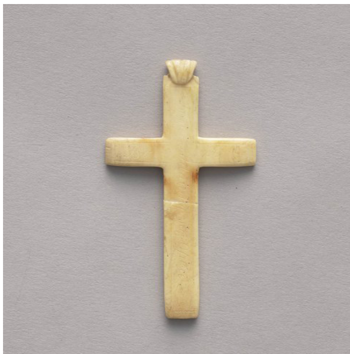
C Krzyżek z napisem: 1864/5 sierpnia, Muzeum Warszawy