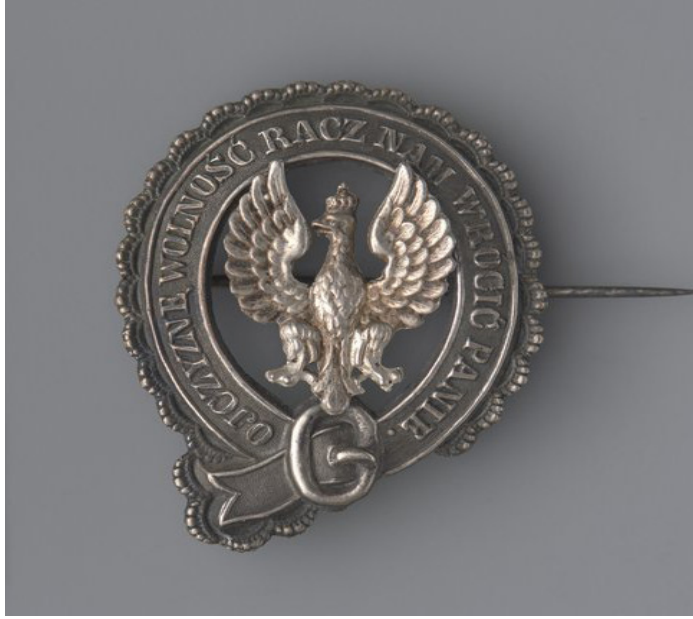
Broszka w formie pasa, po 1863, Muzeum Warszawy