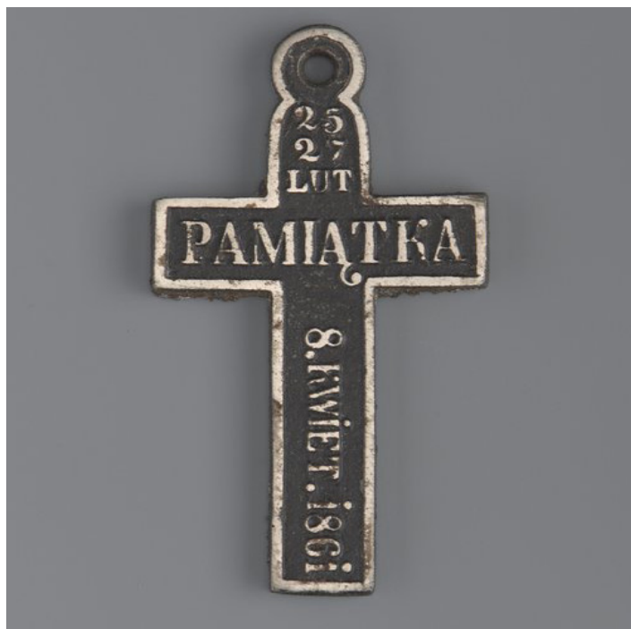
D Krzyżek żelazny, wytwórnia nieznana, 1861, Muzeum Warszawy