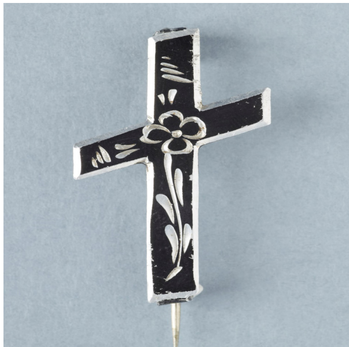
B Biżuteria patriotyczna wydana przez Departament Opieki N.K.N. (Naczelny Komitet Narodowy) na pamiątkę żałoby narodowej z lat 1861-1862, 1914-1917, Muzeum Narodowe w Krakowie