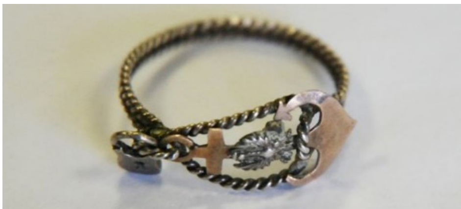
Pierścionek z kotwicą i orłem, 1861-1862, zbiory MHP

4 ■ Przyjrzyj się fotografii i wskaż, które elementy pierścionka mają wymowę patriotyczną. Uzupełnij poniższą tabelkę.