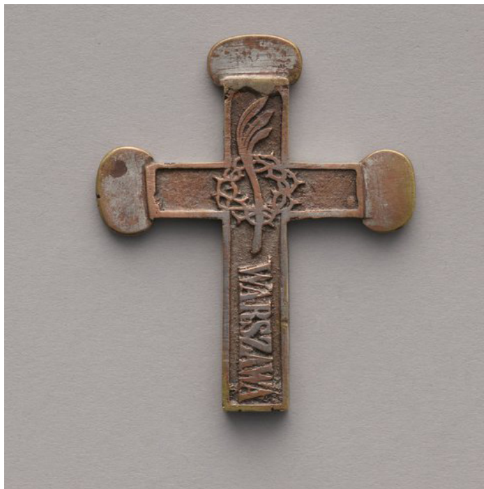
A Krzyżek żelazny, 1861, Muzeum Warszawy

2 ■ Przyjrzyj się fotografiom i ustal, które krzyże wykonano przed Powstaniem (w okresie patriotycznych manifestacji), które w trakcie trwania insurekcji, a które po jej zakończeniu. Uzasadnij swój wybór.