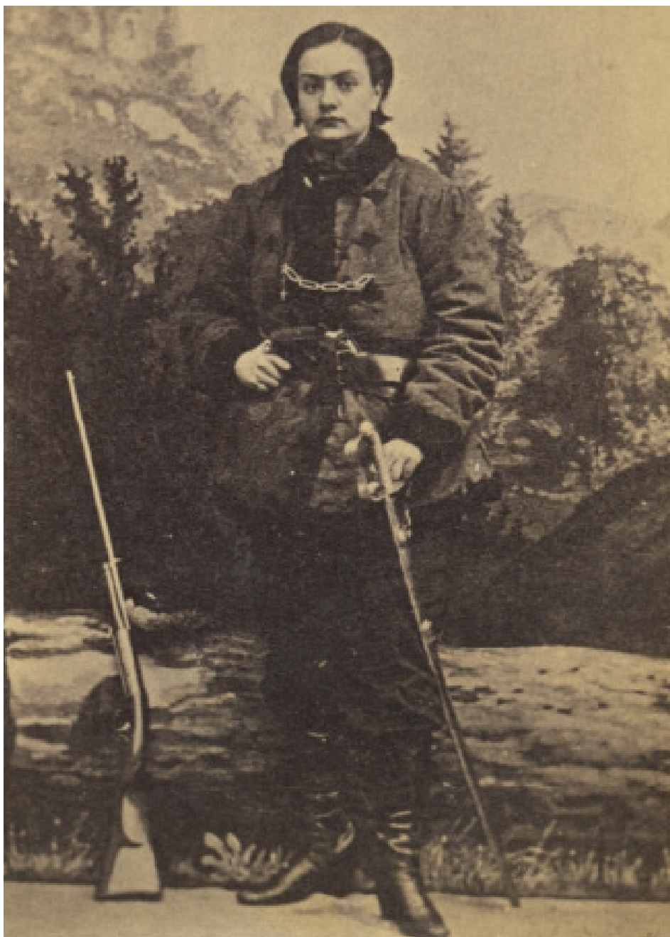
Henryka Pustowójtówna (1838-1881)